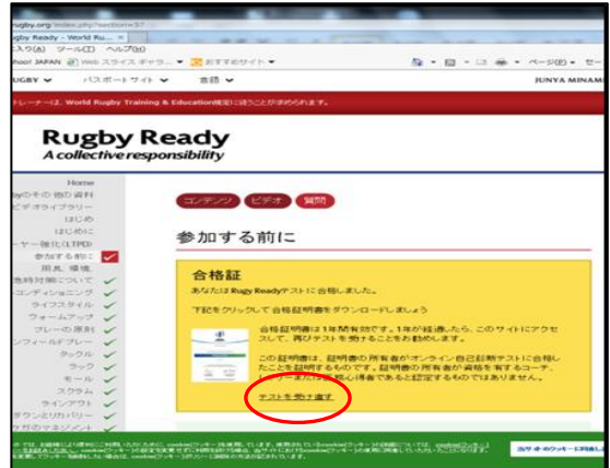
⑤ 合格証の黄色の枠の下にある「テストを受け直す」をクリックし、再度テストを受け直す。