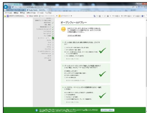
⑥ 各設問に答えて進んでいく。