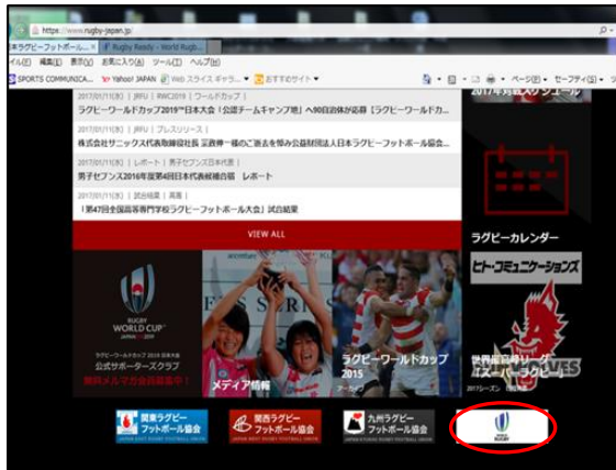
① 日本協会HPより「WORLD RUGBY」のバナーをクリックする。